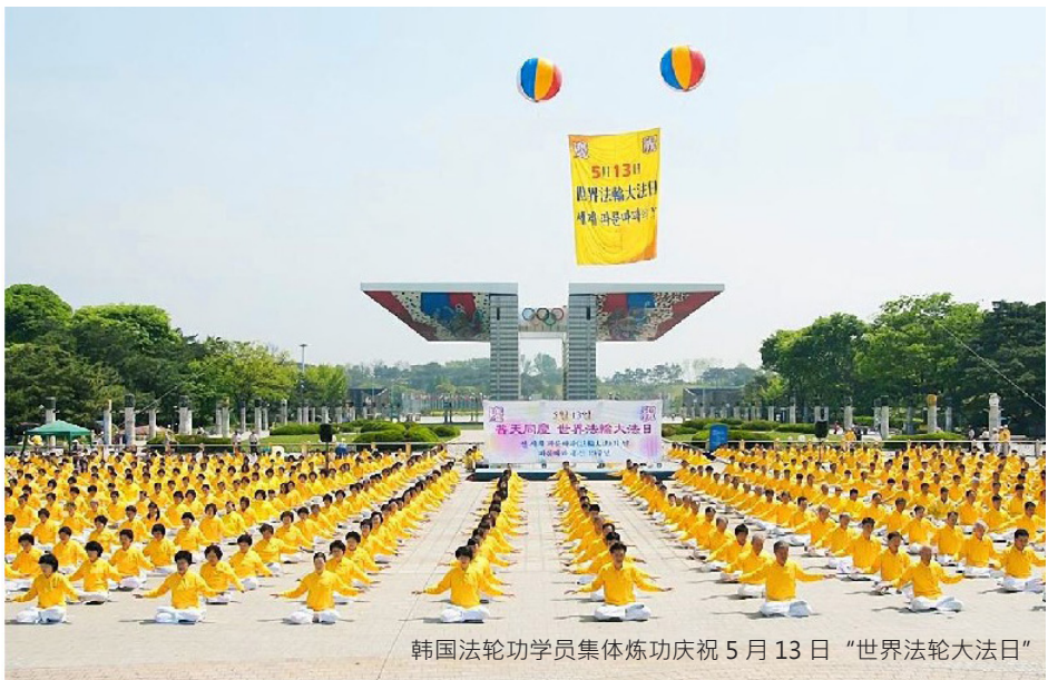
韩国法轮功学员集体炼功庆祝5月13日“世界法轮大法日”

理学研究的人做过很多测试，比如说这个人突然遭遇了车祸等意外事故去世了。有的人平时挺健康的，突然查出来是癌症晚期，没几个月也去世了。你去看他的八字，就能看出来和他的死期完全相符。