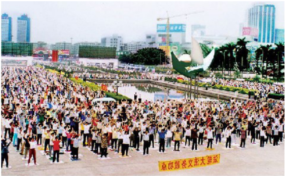
上图为 1998 年广州一个炼功点的法轮功学员晨炼。