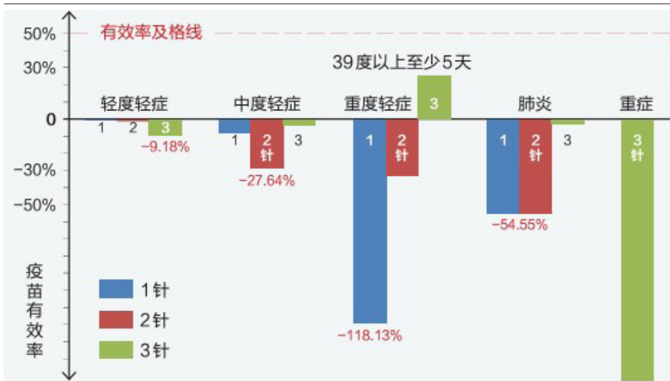
2022年12月19日公布的7000份问卷，以其统计数据计算，惊见疫苗有反作用。