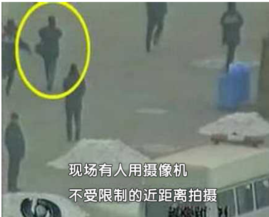
现场有人用摄像机 不受限制的近距离拍摄

从起火到扑灭火，前后90秒，这样的突发事件，警察怎么可能带着大量的消防设备巡逻，突然冒出几十个灭火器灭火毯。而且新闻