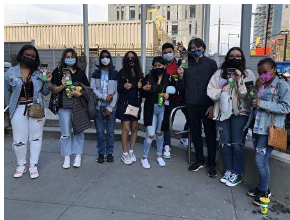
5 月 2 日在纽约华人社区法拉盛，一群非裔和西语裔年轻人在“EndCCP”倡议书上签名。

全球退党服务中心去年 6 月发起“打倒中共恶魔”（Eliminate the Demon Chinese Communist Party），全球范围的征签在持续进行中，人数滚雪球增长，截至 5 月 2 日，全球各地民众在 EndCCP.com 网站的连署，达 86 万多人。